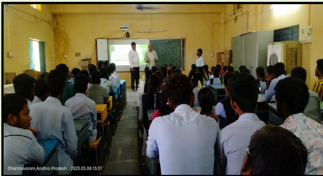
RJD Sir interacting with students in the Virtual Class Room

He also enquired about the allotment of students to the companies for the 15 week internship and maintenance of log book for the period of internship by the students under the supervision of respective mentors.